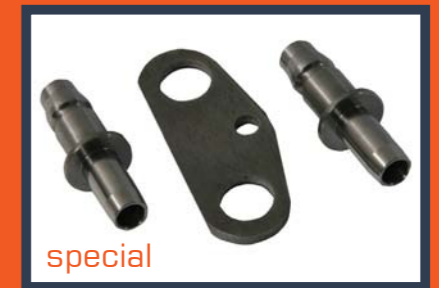
special Audi Q5/Q7