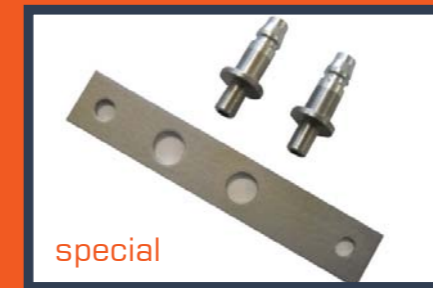
special Opel Insigna >2010